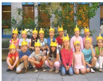
Die 1. VS. Int. hat im 2. Semester wieder viele tolle Dinge erlebt (S. 3).

China in Bildern – ein Rückblick auf ein gelungenes Projekt der Klassen 1. KMS, F3 und F4 (S. 4-5).