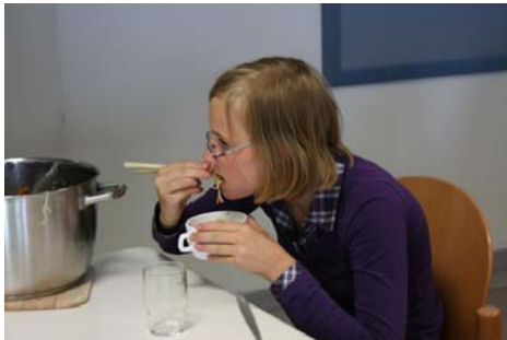
Essen mit Stäbchen