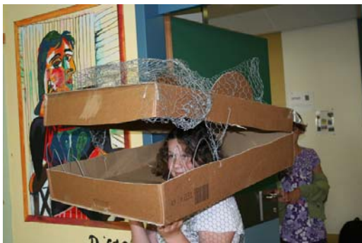
Daraus wurde ein Drachenkopf