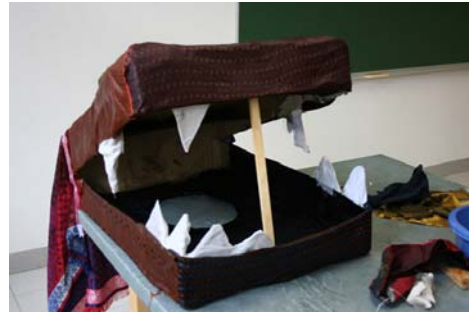
Der fertige Drachenkopf