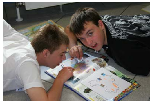
Arbeit mit dem Atlas