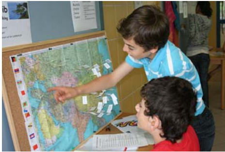
Transsibirische Eisenbahn (Route)