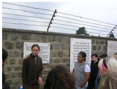
Nationalsozialismusprojekt und Besuch im KZ Mauthausen (S. 2).

...und viel Erfolg für das Schuljahr 2009/2010