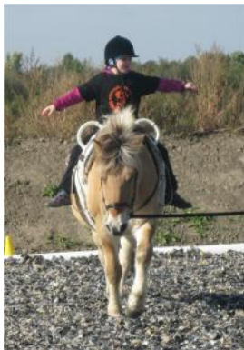
Viola, 4. Int