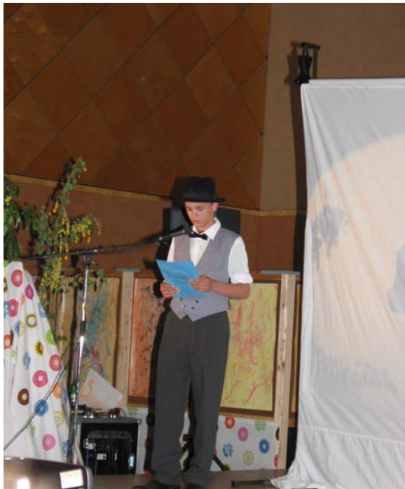
Präsentation in der Mode des jeweiligen Jahrzehnts.