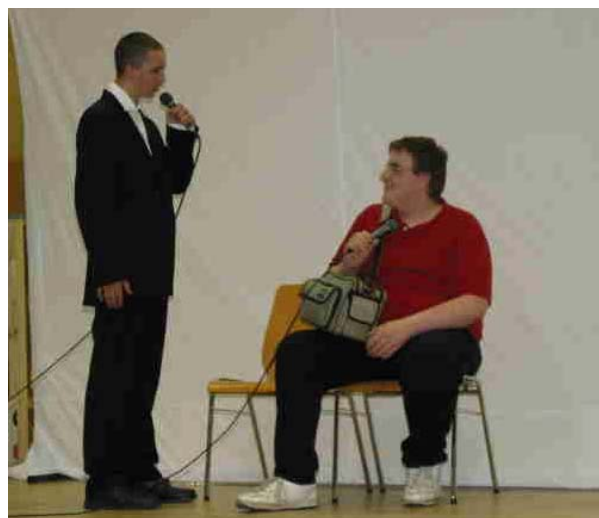
Anti-Gewalt Theaterstück, inszeniert vom Polytechnikum