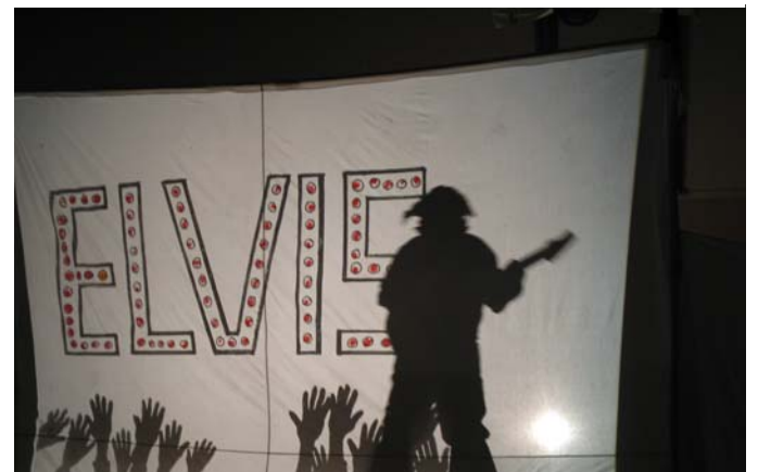
Elvis Presley: „Hound dog“