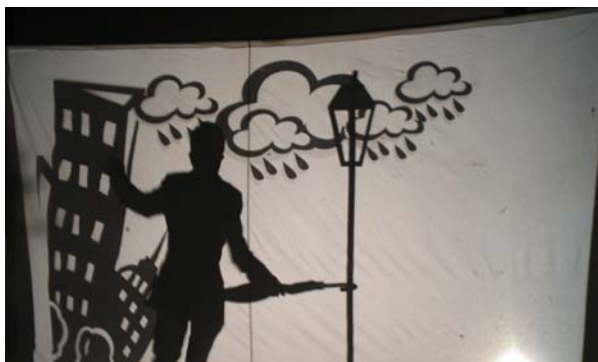
Gene Kelly: "I'm singing in the rain"