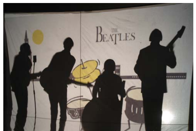
The Beatles: „She loves you“