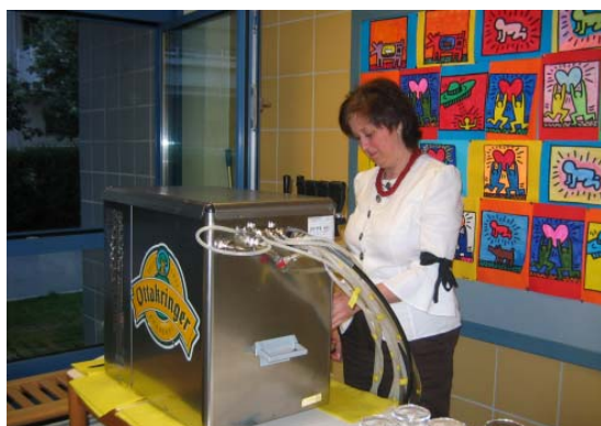
„Alles klar an der Bar“