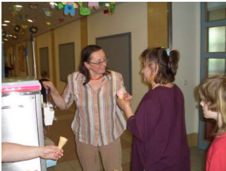
... von Fr. Direktor Brigitte Aigner